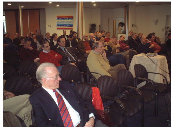
Figuur 8. Lustrumcongres 2004 op Vlieland