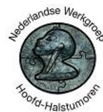
Fig. 17 Logo NWHHT 2004-heden

Dit ontwerp was oorspronkelijk bedoeld voor de erepenning van de NWHHT, uitgereikt aan leden met grote verdienste voor de NWHHT en/of de hoofd-halsoncologie in Nederland.