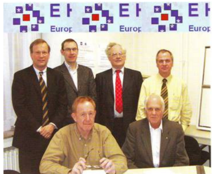
Figuur 14 Oprichtingsvergadering EHNS, Brussel

Met de beroepsverenigingen voor Keel-, Neus- en Oorheelkunde en Heelkunde van het Hoofd-Halsgebied en voor Mondziekten en Kaak- en Aangezichtschirurgie werden vervolgoopleidingen tot hoofd-halschirurg opgezet (KNOVOO en KIVOO), waarbij de opleidingsklinieken voor dit doel worden gevisiteerd.