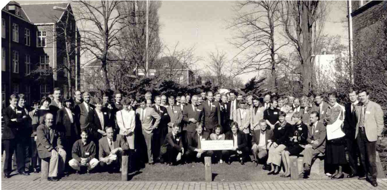
Figuur 5. Workshop uniforme documentatie en registratie 1991, Leiden

Tijdens de lustrumcongressen in 1994 in Hoenderloo, 1999 in Epe en 2004 op Vlieland, werden respectievelijk de grenzen van de zorg verkend, protocol/preventie en palliatie nader belicht en werd bij het laatste lustrum teruggekeken op 20 jaar behandeling in het hoofd-halsgebied en werd de veranderende "state of the art" in behandeling gedurende 20 jaar in beschouwing genomen.