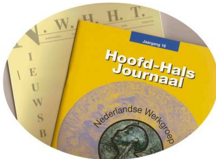
Figuur 14 Tijdschrift NWHHT