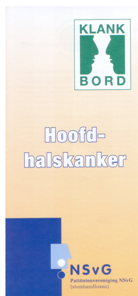
Figuur 12 Gemeenschappelijke folder van de patiëntenorganisaties.