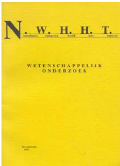
Figuur 9. Publicatie 1994 Wetenschappelijk onderzoek