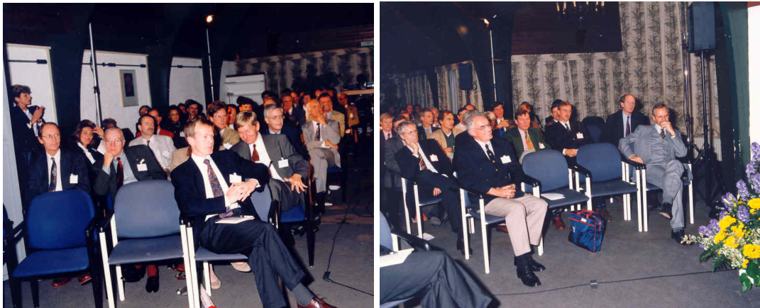
Figuur 6. Lustrumcongres 1994 in Hoenderloo

Tijdens de lustrumcongressen in 1994 in Hoenderloo, 1999 in Epe en 2004 op Vlieland, werden respectievelijk de grenzen van de zorg verkend, protocol/preventie en palliatie nader belicht en werd bij het laatste lustrum teruggekeken op 20 jaar behandeling in het hoofd-halsgebied en werd de veranderende "state of the art" in behandeling gedurende 20 jaar in beschouwing genomen.