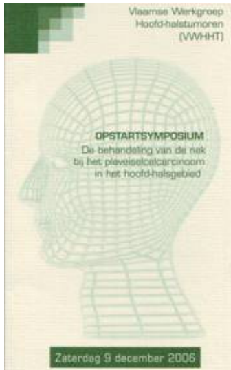
Figuur 15. Opstart symposium VWHHT

Al deze projecten, vergaderingen, symposia en congressen konden slechts worden uitgevoerd dankzij een uitstekend secretariaat. In de eerste jaren werd de secretariële ondersteuning van de NWHHT voorzien vanuit het IKA door mevrouw Els Steenland en later door mevrouw Mirjam Boon. De jaren daarop volgend, vanaf 1989 tot heden, regelde mevrouw Ria van Heerden van Putten, aanvankelijk vanuit het IKMN, de laatste jaren free lance in dienst bij de NWHHT, op voortreffelijke wijze en met strakke hand de zaken.