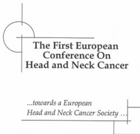
Figuur 13. 1 e Europese Congres, Lille