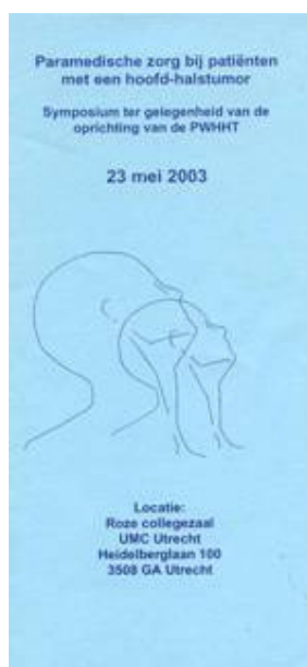
Figuur 11. Symposium PWHHT

Ook met de beide patiëntenorganisaties, de Nederlandse Stichting voor gelaryngectomeerden en de Stichting Klankbord, is in de loop der jaren een nauwe samenwerking gegroeid die heeft geresulteerd in tweejaarlijkse besprekingen tussen NWHHT en de patiëntenorganisaties. Hierdoor zijn de patiëntenorganisaties onderling ook steeds nader tot elkaar gekomen.