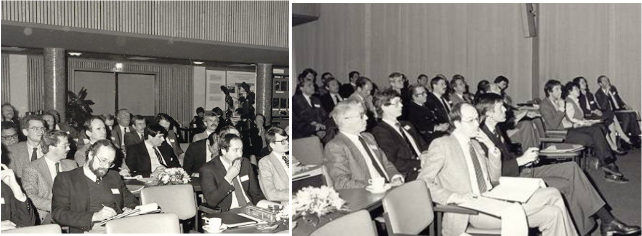
Fig. 1. Workshop Rotterdam 1983

Op 8 april 1983 werd in Rotterdam de workshop "Plaveiselcelcarcinoom van de mobiele tong - mondbodem" georganiseerd.