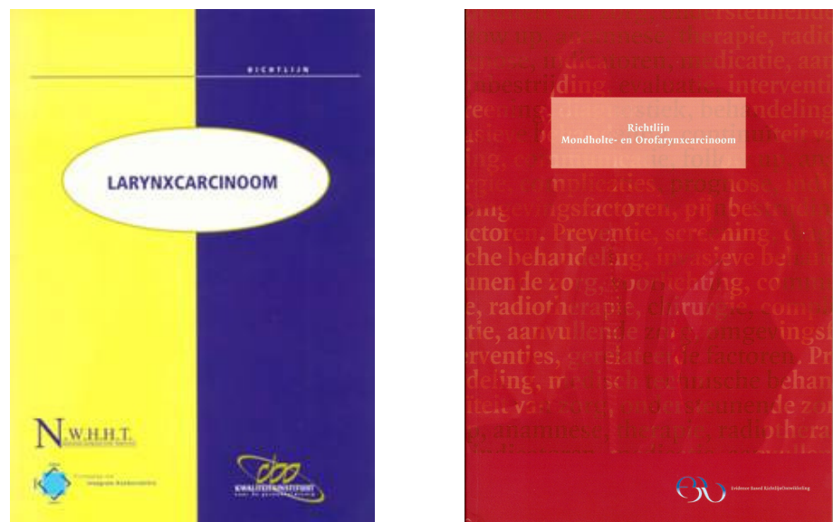
Figuur 10. Richtlijnen uitgeven door NWHHT, VIKC en CBO

De NWHHT was ook voortrekker bij het ontwikkelen van richtlijnen voor diagnostiek en behandeling van tumoren in het hoofd-halsgebied.