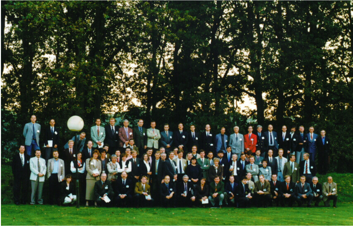
Figuur 7. Lustrumcongres 1994 in Hoenderloo